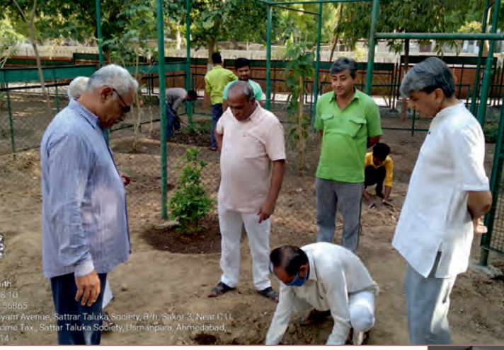
11/05/2022 5:08:65 yam Avenue, Sattar Taluka Society, B/H, Sakor-3, Near C.U. Home Tax, Sattar Taluka Society, Usmanpura, Ahmedabad, 14

તા. ૫/૬/૨૦૨૨ના રોજ વિશ્વ પર્યાવરણ દિવસ નિમિત્તે આયોજિત વૃક્ષારોપણ કાર્યક્રમ