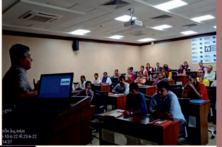
તાલીમ કેન્દ્ર, સાદરા 10-6-22 થી 23-6-22 14:37

તા. ૧૦/૦૬/૨૦૨૨થી તા. ૨૩/૦૬/૨૦૨૨ દરમિયાન આયોજિત પંચાયતીરાજ તાલીમ કેન્દ્ર, સાદરા દ્વારા આયોજિત ઓપવર્ગ તાલીમ